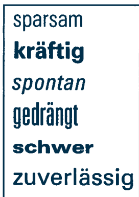
Hasło – nagłówek